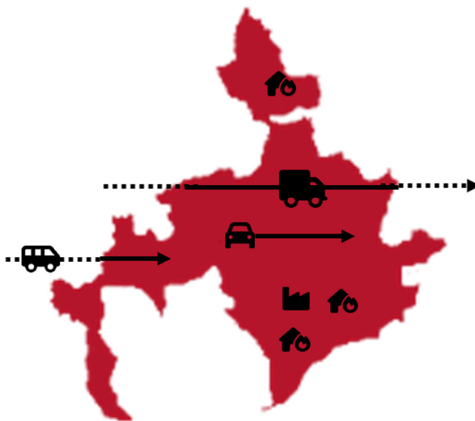
Abbildung 1 | Bilanzierungsmethodik nach dem Territorialprinzip für die Gemeinde Friedland

Die wichtigste Kenngröße innerhalb einer Treibhausgas-Bilanz ist die Emission von Kohlendioxid (CO 2 ), welches bei der Verbrennung fossiler Brennstoffe (Kohle, Erdöl, Erdgas etc.) freigesetzt wird. CO 2 leistet den größten Beitrag zum Treibhauseffekt und wird als Leitindikator für die Treibhausgase verwendet. Neben Kohlendioxid (CO 2 ) haben weitere Gase wie Methan (CH 4 ) oder Fluorkohlenwasserstoffe (FCKW) Einfluss auf den Treibhauseffekt. Die verschiedenen Gase tragen jedoch nicht in gleichem Maß zum Treibhauseffekt bei und verbleiben über unterschiedliche Zeiträume in der Atmosphäre. So hat Methan eine 25-mal größere Klimawirkung als CO 2 , verbleibt aber weniger lange in der Atmosphäre.